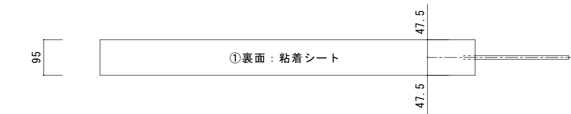
断面図 【 a-a' 】