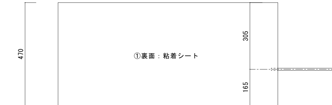
断面図 【 a-a' 】