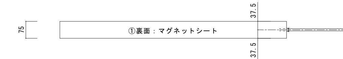
断面図 【 a-a' 】