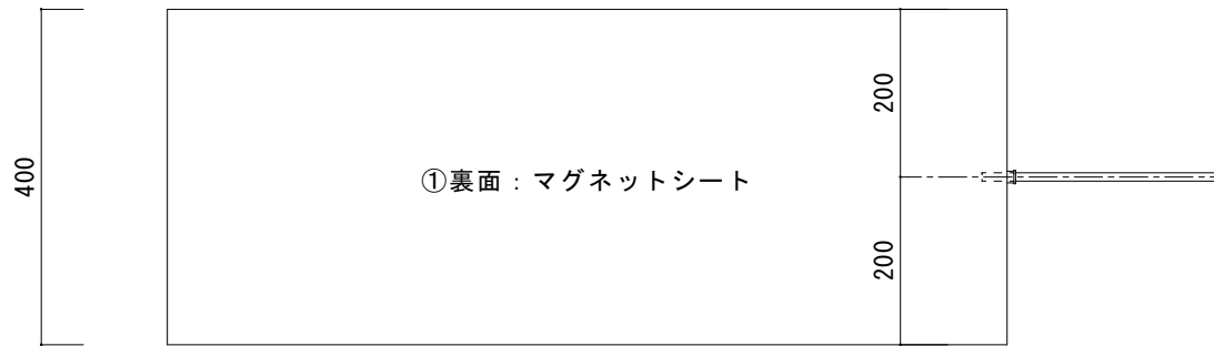
断面図 【 a-a' 】